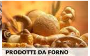
PRODOTTI DA FORNO